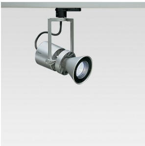
Le Perroquet - Projecteur avec transformateur électronique à variation 50 W QR CBC 51